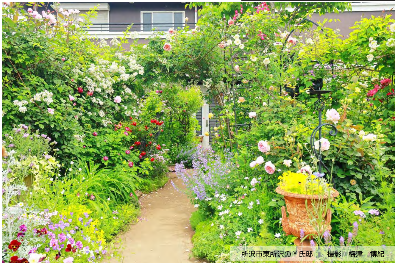
所沢市東所沢のY氏邸