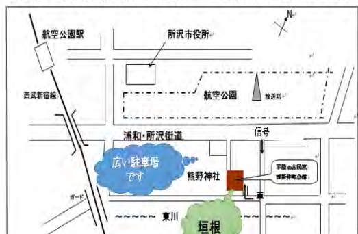
O会場「西新井町会館」一概略図一 住所: 所沢市西新井町 17-33 (熊野神社境内)