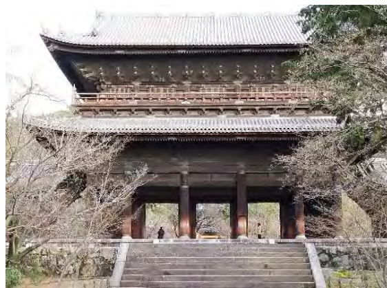
南禅寺三門（重要文化財）

かつて京都には修学旅行でしか行ったことがなく特別興味があったわけではありませんでした。